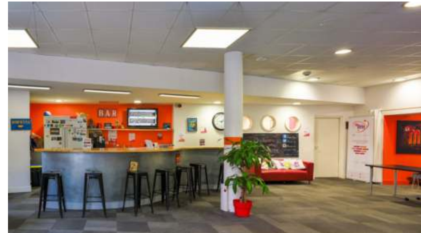
Salle de pause : frigo, four, micro-onde, machine à café