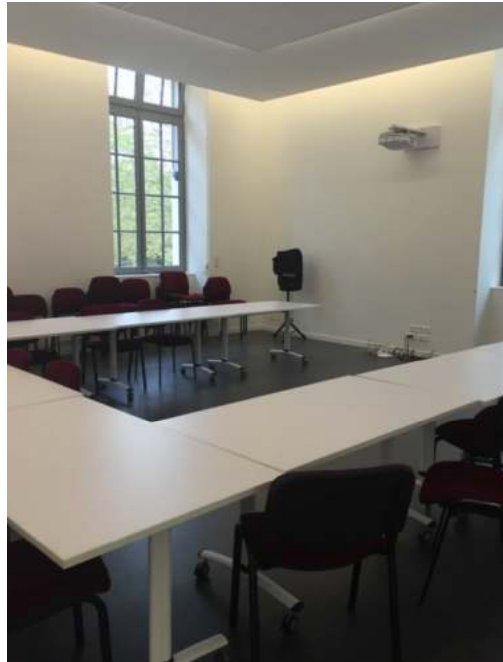
Salle de formation : wifi, vidéo-projecteur, paper-board