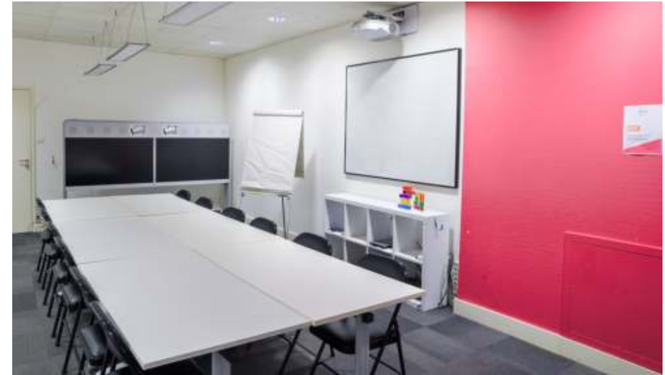
Salle de formation : tableau blanc, wifi, chauffage et vidéo-projecteur